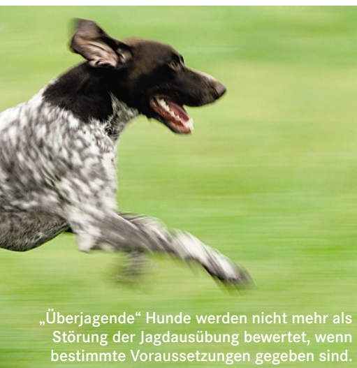
„Überjagende“ Hunde werden nicht mehr als Störung der Jagdausübung bewertet, wenn bestimmte Voraussetzungen gegeben sind.