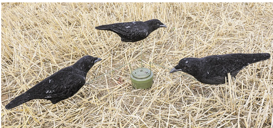
... der Einsatz von elektronischen Hilfen (Karusselle).