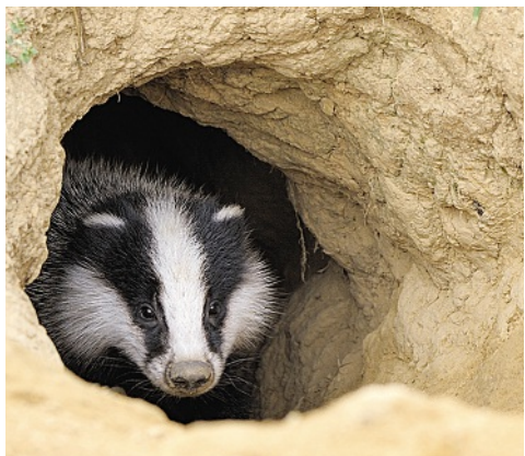
Die Baujagd auf Dachse ist generell verboten,