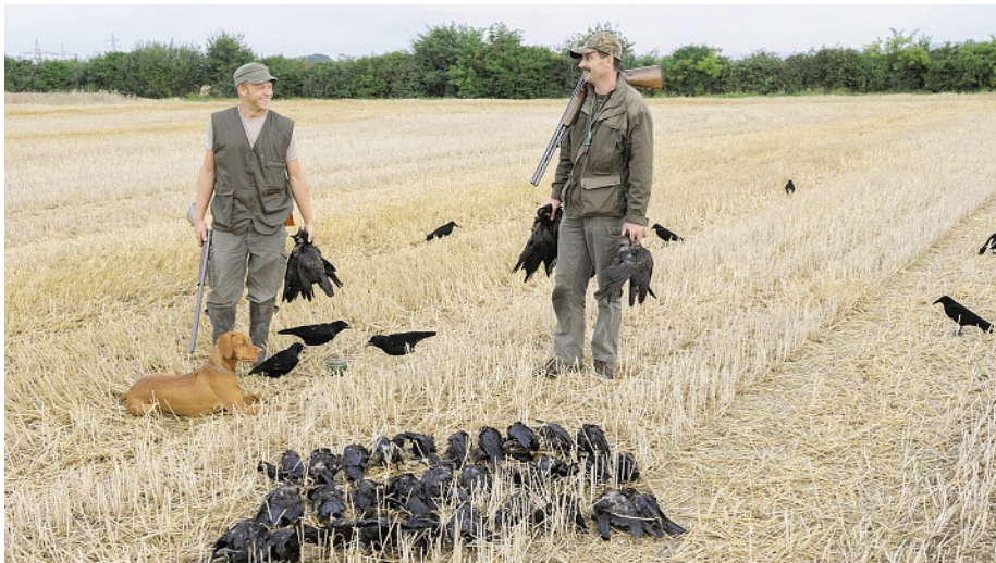
Die Lockjagd auf Krähen außerhalb der Einzeljagd ist ab sofort verboten, ebenso wie...

Überjagende Hunde bei Bewegungsjagden stellen keine Störung der Jagdausübung dar, wenn betroffene Jagdbezirksinhaber im Vorfeld unterrichtet wurden,