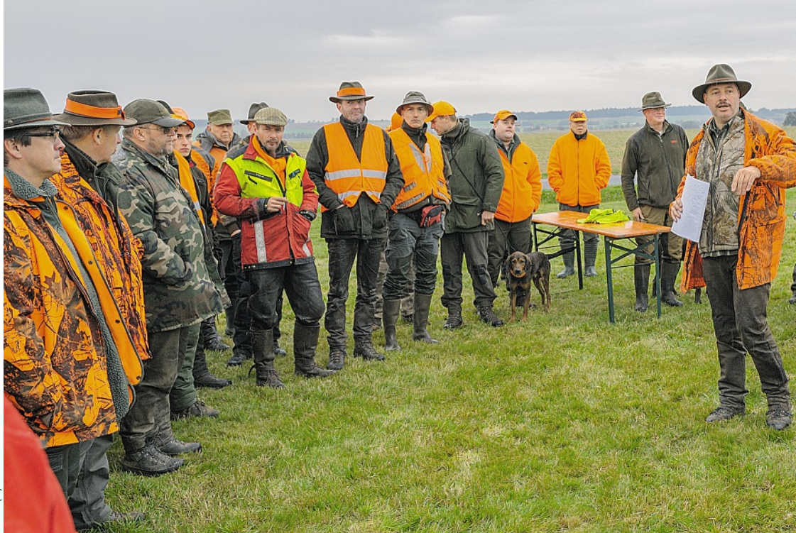
Bei Bewegungsjagden auf Schalenwild obliegt dem verantwortlichen Jagdleiter ab sofort nicht nur die Kontrolle der gültigen Jagdscheine – er muss sich auch davon überzeugen, dass jeder Teilnehmer im Besitz eines aktuellen Schießnachweises ist ...