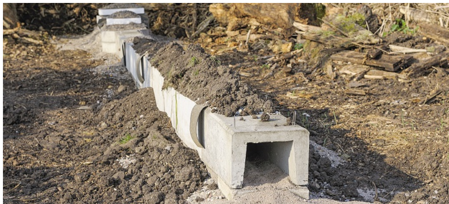
Füchse darf man an Kunstbauten in Ausnahmefällen auch weiter bejagen.